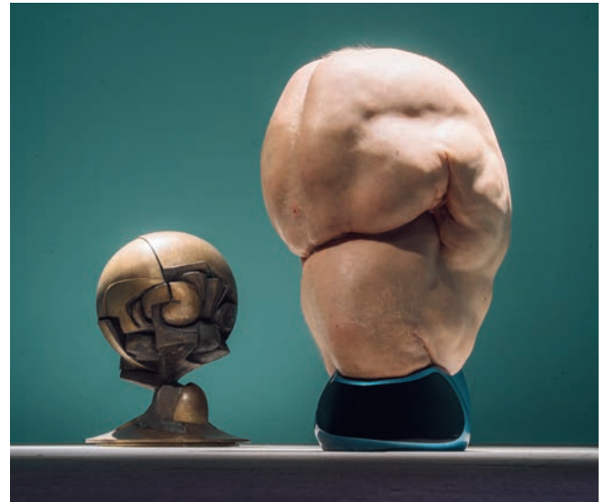
Fritz Koenig Kugelkaryatide V N.Y., 1968

Piccinini hat mit ihren lebensecht wirkenden Hybriden aus Mensch, Tier, Pflanze und Maschine in den letzten fünfzehn Jahren weltweit für Aufsehen gesorgt. Nach Singapur, Rotterdam, Stockholm und Halle ist nun Landshut die nächste Station einer weltweiten Tournee dieser außergewöhnlich faszinierenden Künstlerin.